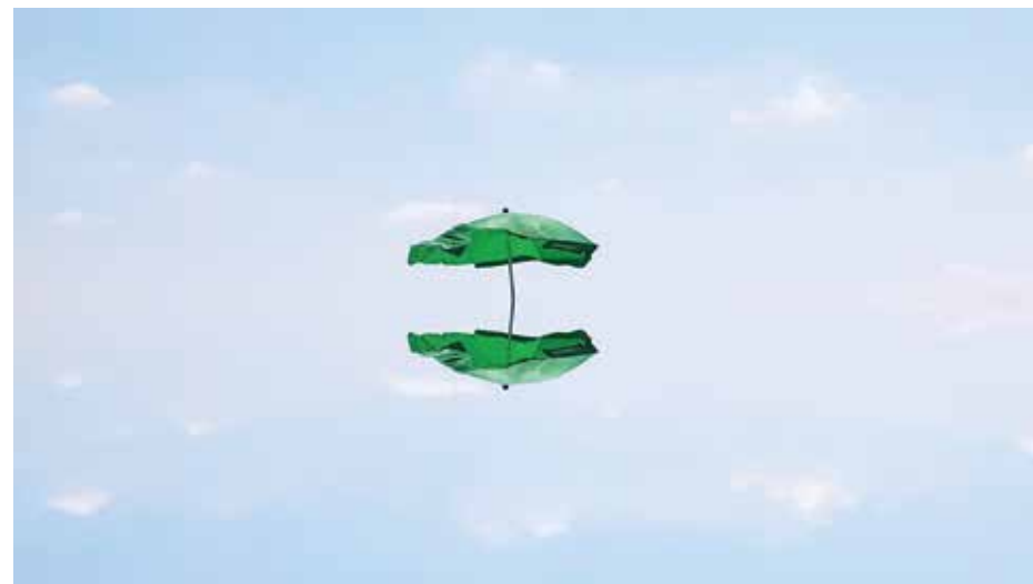
מאיה סמירה, "השתקפויות", 2018