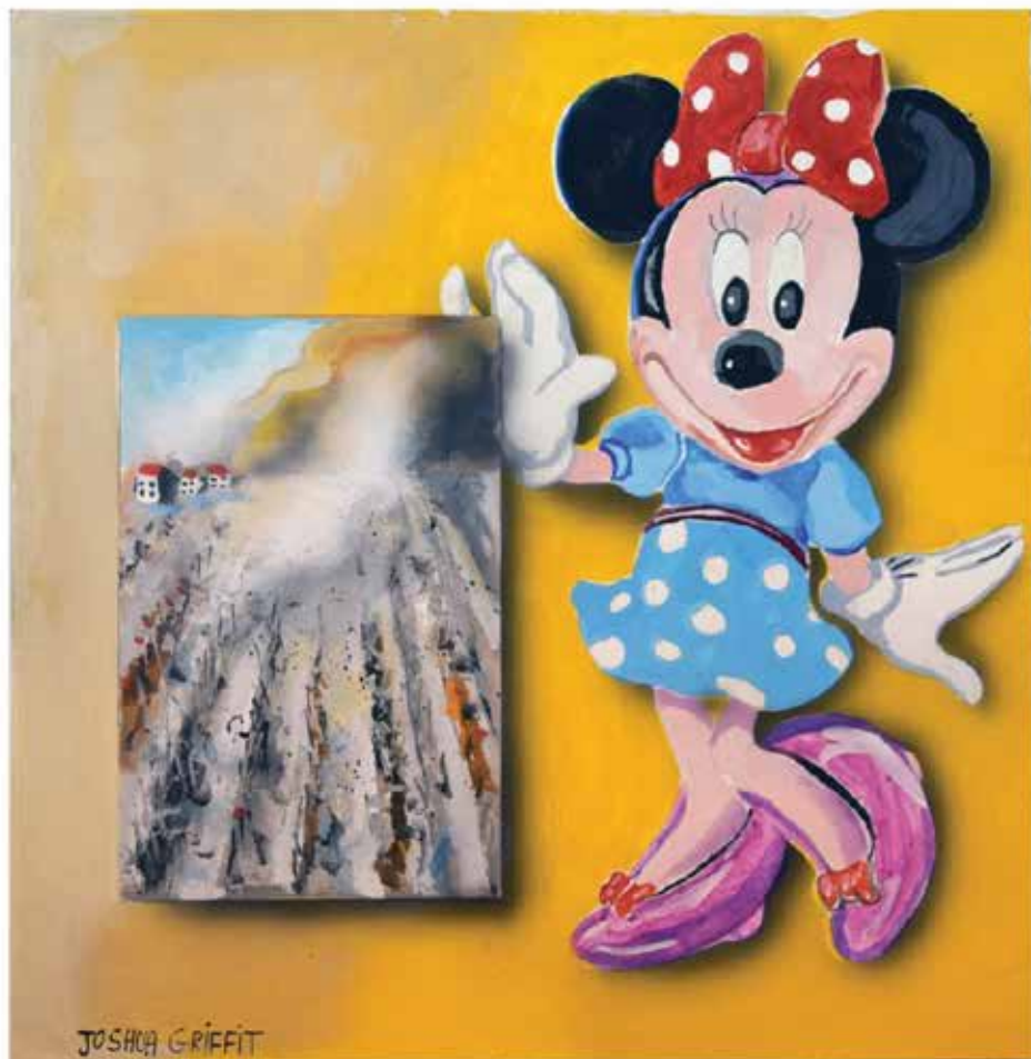
Joshua Griffit, See the Field Burn , 2019 Acrylic on paper