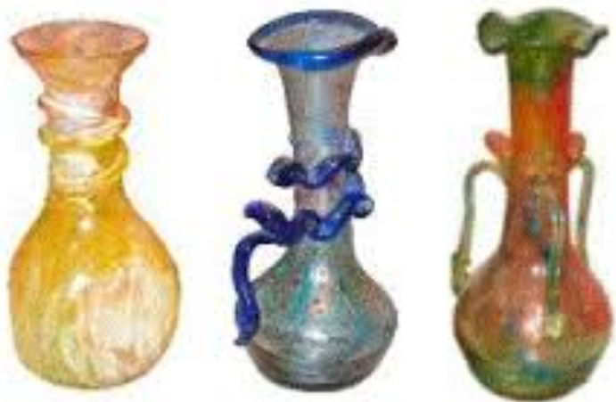
זכוכית וונציאנית (מורנו)